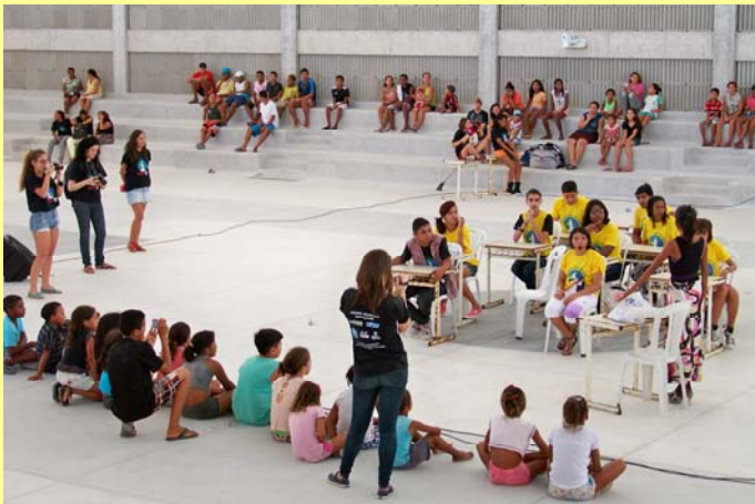
Jovens multiplicadores em cena