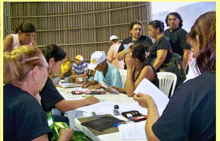
Equipe realizando ação de prevenção junto a moradores